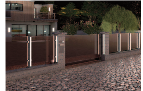
Option – integrierte Beleuchtung für den Einfahrtsbereich