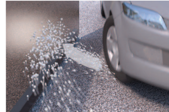
Schutz durch Schlagsicherheit

Bei diesem speziellen VSG bilden zwei oder mehr ESG-Scheiben mittels hochfester PVB-Zwischenschichten einen festen, hochwiderstandsfähigen Verbund.